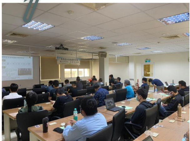
加強員工節水觀念