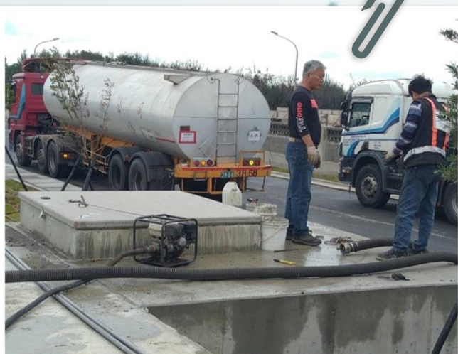
水車載污水廠排放水 予澆灌使用